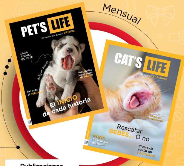
Publicaciones Pet's Life y Cat's Life